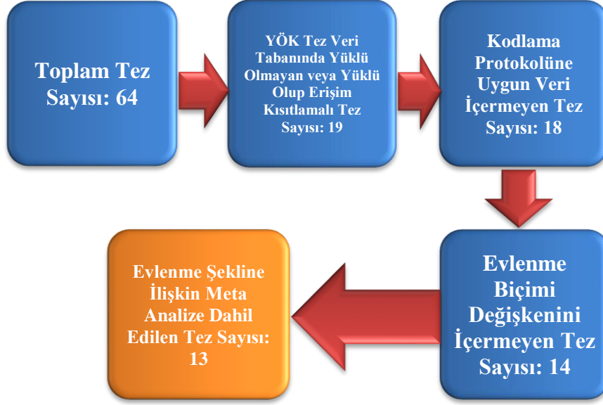
Şekil 1: Alanyazın taraması sonucu ulaşılan kaynakların araştırmaya dâhil edilme sürecine ilişkin akış diyagramı

Meta analize dahil edilen çalışmaların seçilme sürecine ilişkin akış diyagramı Şekil 1’de verilmiştir.