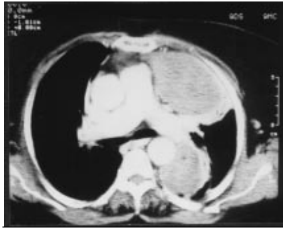
Resim 2. Her iki ana pulmoner arter düzeyinden geçen bilgisayarlı tomografi kesitinde iki adet kalın çeperli loküle plevral sıvı ve normal izlenen inen aorta görülmektedir.