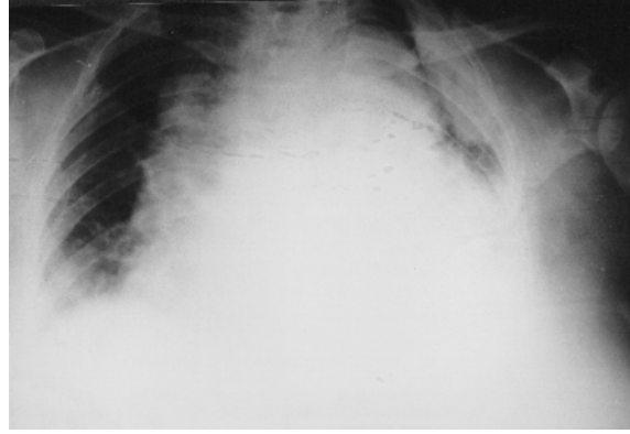
Resim 1. Torasik aorta anevrizması rüptürü sonrası gelişen hemotoraksın izlendiği PA akciğer grafisi