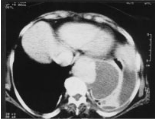
Resim 4. Aşağı torakal düzeyden geçen kesitte laterale bombeleşmiş ve genişlemiş inen aorta izlenmektedir.

yapıldı ve sitolojik incelemede malignite saptanmadı. Bilgisayarlı toraks tomografisi de tekrarlandı. Descenden aortun proksimal bölgesinde aortada kenar düzensizliği saptanması üzerine (Resim 4) anevrizma düşünülen hastaya sol anterolateral torakotomi yapıldı. Operasyonda aortun subklavian arter ayrımından beş cm distalden itibaren diafragma kadar anevizmatik olduğu görüldü. Anevrizma kesesine yapışık, destükte ve içi hematoma dolu olan sol alt lob rezektö edildi. 24 milimetrelilik kollajen kaplı dakron greft (Hemashield) anevrizmanın proksimal ve distaline kemp konulmasından sonra interpoze edildi ve üzeri anevrizma kesesi ile sarıldı (wrapping). Kross klemp süresi 27 dakika idi. Klemp kaldırıldıktan sonra hipotansiyonu oldu. Perikart açıldığında sol ventrikül kontraksiyonlarının zayıf olduğu saptandı. Atriyo-femoral bypas ve yüksek doz inotrop desteğe rağmen yanıt alınamadı. Hasta kaybedildi.