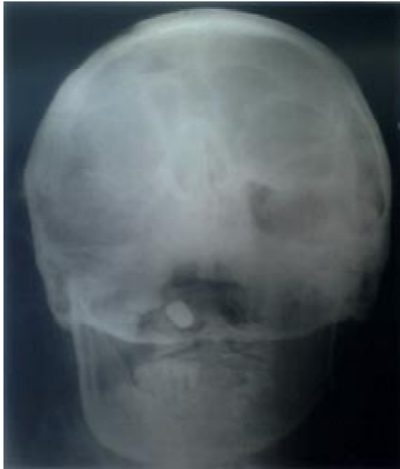
Resim 2. Ağız açık Odontoid grafisi: Kurşun çekirdeği ile Odontoid-C1 kompleksi ilişkisinin görüntüsü.

Kliniğimize yatırılan hasta preoperatif hazırlıklarını takiben operasyona alındı. İlk