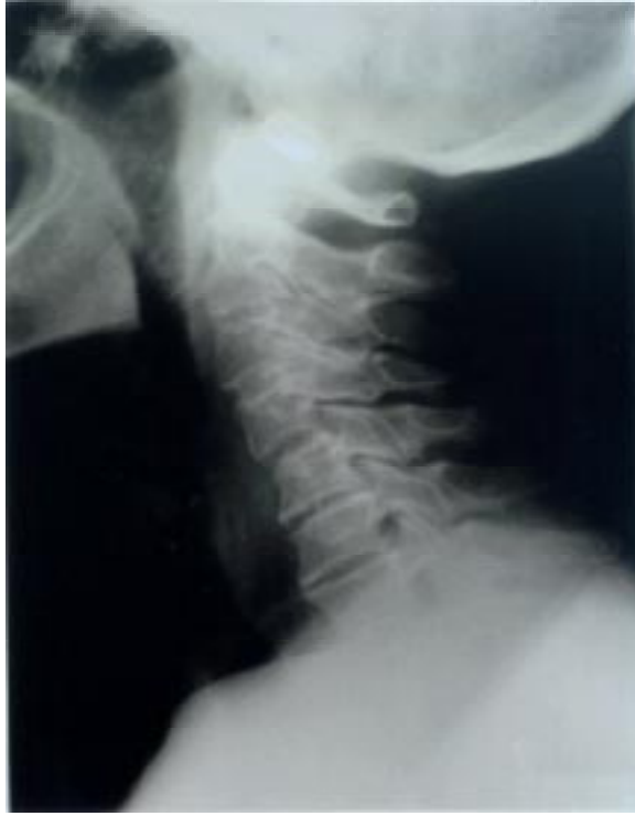
Resim 1. Yan servikal grafi: C1-oksiput arasında yerleşmiş kurşun çekirdeğinin görüntüsü.