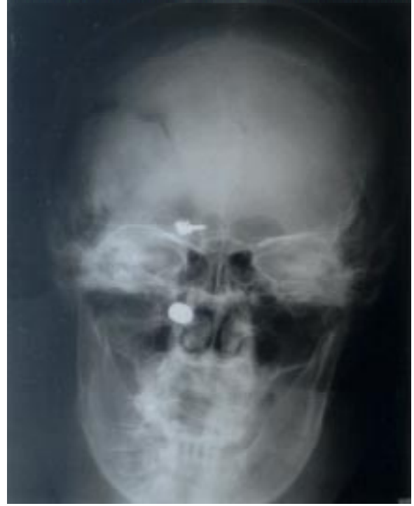
Resim 3. Ön-arka grafi: Kurşun çekirdeğine ek olarak daha önce geçirilmiş anevrizma ameliyatına ait anevrizma klibinin görüntüsü.

Kliniğimize yatırılan hasta preoperatif hazırlıklarını takiben operasyona alındı. İlk