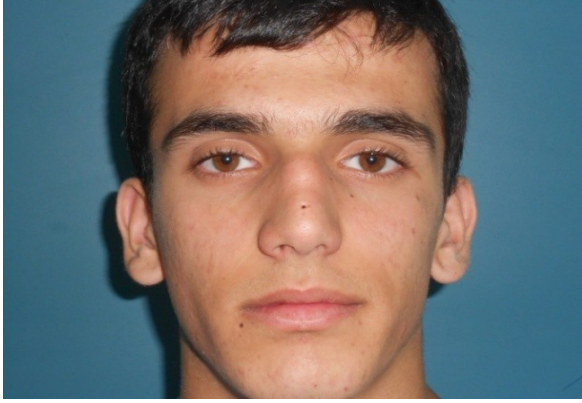
Resim 1. Hastanın Preoperatif Önden Görünümü

gibi görünen delikle devamlılığı ve intrakranyal uzanım olup olmadığını görüntülemek amacıyla da MR istendi. MR görüntülerinde intrakranyal uzanım olmayan (Resim 3,4) hasta MR ve BT ile birlikte değerlendirilerek, açık septorinoplasti tekniğiyle kist ve fistülün tamamen çıkarılmasına karar verildi.