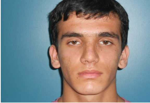
Resim 7. Hastanın postoperatif 3.ay önden görüntüsü