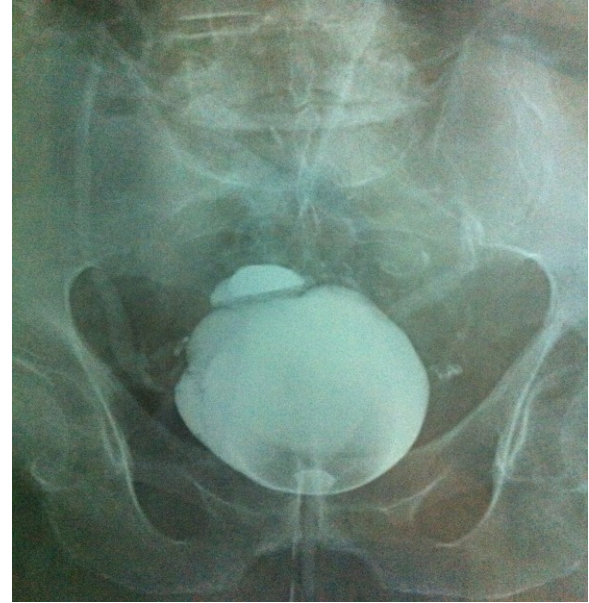
Resim 3. Operasyon sonrasında çekilen kontrol sistografi

Operasyon sırasında ve sonrasında komplikasyon gelişmedi. Operasyon sonrasında 7. günde üretral kateteri çekilen hastanın kontrol sistografisi normal olarak değerlendirildi (Resim 3).