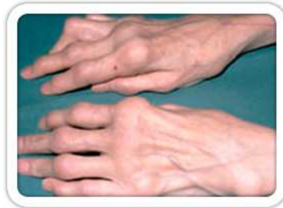
Şekil 2: İleri evre RA'da gelişen el-bilek ve eklem deformiteleri

Hastalığın ileri evrelerinde el eklemlerinde deformiteler görülebilir (Şekil 2-3).