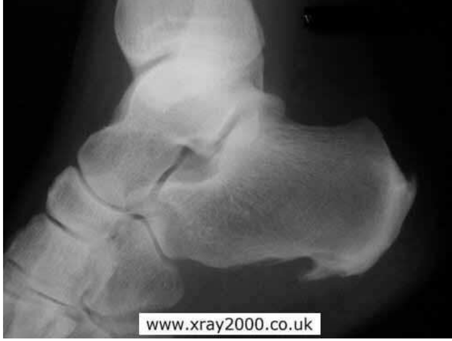
Şekil 7: Aşilde entezitis

Periferik eklem tutulumu hastaların %33'ünde görülür. En sık tutulan eklem kalça eklemidir. Genellikle bilateraldir ve hastalığın ilk 10 yılında tutulur. Diğer tutulabilen eklemler: Omuz kuşağı (glenohumeral, akromiyoklaviküler, sternoklaviküler), kostovertebral, kostosternal, manibrosteral, simfisis pubis ve temporomandibüler olarak sayılabilir.