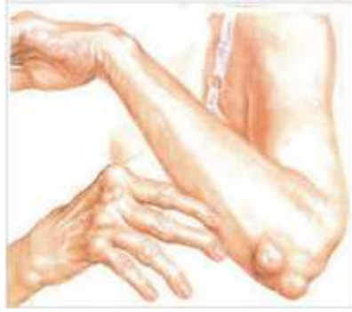
Şekil 1: Romatoid nodül