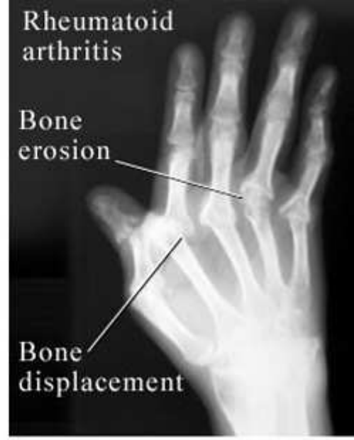
Şekil 3: RA'da eklem deformitelerinin radyografik görüntüsü

Düğme iliği deformitesi (eş zamanlı olarak PİF'lerde fleksiyon ve DİF'lerde hiperekstansiyon olarak tanımlanır) ve kuğu boynu deformitesi (MKF eklemlerde fleksiyon kontraktürü, PİF'lerde hiperekstansiyon ve DİF'lerde fleksiyon olarak tanımlanır) elde görülen deformitelerdendir.