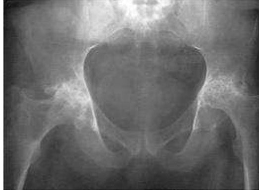
Şekil 4: RA'da bilateral kalça eklemının tutulumunu gösteren radyografi

6. Diz: Sinovyal effüzyon ve kalınlaşma diz muayenesi sırasında kolayca tespit edilir. Baker kisti gelişebilir.