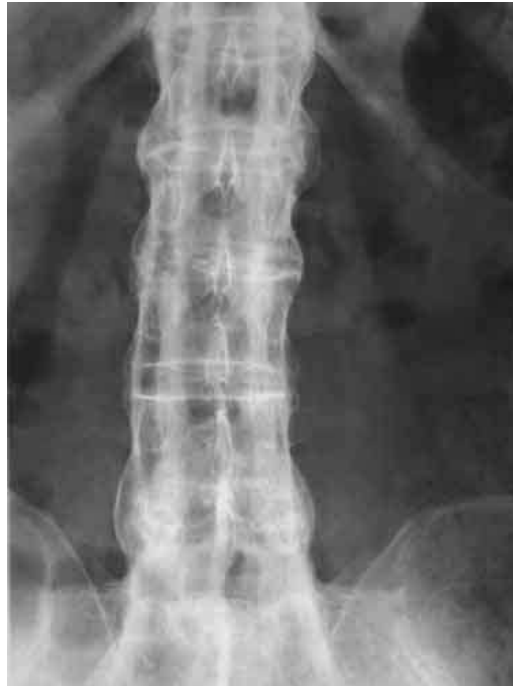
Şekil 6: Bambu omurga

Spinal hastalık sakroiliak eklemlerde başlamaktadır. Çoğu hastada hafif kronik hastalık veya remisyon periyodları ile intermittan ataklar şeklinde hastalık seyretmektedir. Spinal hastalık nadiren persistan seyredebilmektedir. Süreç genellikle lumbosakral bölgeden başlamakta, annulus fibrosisde ossifikasyon ile omurgada füzyon gelişebilmektedir (bambu omurga) (şekil 6). 3