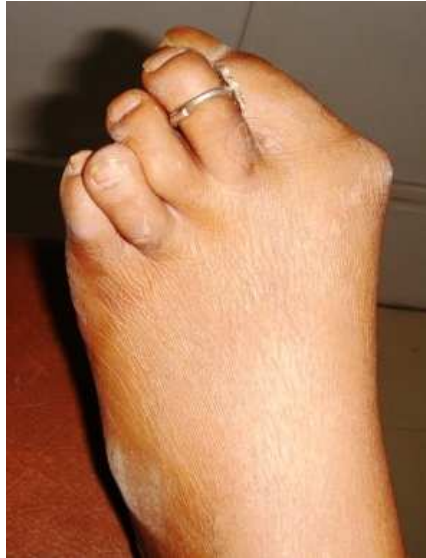
Şekil 5: RA'ya bağlı olarak, ayaklarda gelişen eroziv artrit

7. Ayak ve Ayak Bileği: MTF ve talonaviküler eklem tutulumu olmadan tek başına tutulumu oldukça nadirdir. Halluks valgus, çekiç parmak ve metatars başının ayak tabanına doğru subluksasyon deformiteleri gelişebilir (Şekil 5). Tibial sinir tuzak nöropatisi sonucu tarsal tünel sendromu gelişebilir. 16,17