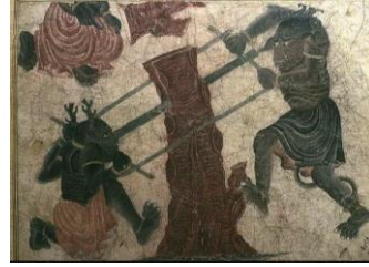
Resim-10: Ağaç kesen Demonlar (34,5 x 25,7). Hazine 2153, s. 141 a. (İpşiroğlu ,2018:95)

Siyah Kalemin yaptığı bu minyatürün ortasında kabuklan çatlamış, nasırlaşmış ihtiyar bir ağaç kütüğü yer almaktadır. Kütüğün iki yanında iki Demon büyük bir bıçkıyla yukardan aşağıya doğru kütüğü ikiye bölmek için uğraşmaktadırlar. Resmin üst kısmında ise yere çömelmiş bir figürün yanında kesik bir kütük parçası devrilmiş durmaktadır. Siyah Kalem'in pek çok resimlerinde olduğu gibi bu kompozisyonda da karşı karşıya duran iki figür (birini önde diğerini arkada) görmekteyiz. Figür imgelerinden birini çömelmiş ötekini ayakta ve her ikisinin de bir ayağını güç almak için ağaca dayanmış olarak betimlendiği görülmektedir. Albüm yapılırken bu resim sadece hızarıcıları gösterecek biçimde kesilmiş bir görüntüdedir. Sol üstteki figürün ise yalnız alt kısmını görülmektedir (İpşiroğlu, 2018: 95). Resimlerde figürler ön plana