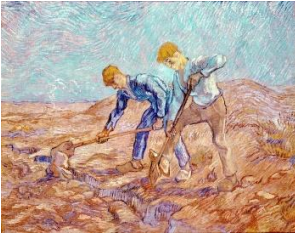
Resim-9: Van Gogh'un "Kazıcıları" ( https://www.spectator.co.uk ,2019 )

Bir yere bağlanmadan tepeden sarkan kurdeleler, mekân olmasa dahi ayakların yere sağlam basması, farklı kültürleri temsil eden farklı şapkalar, her yönden baktığımız hacimli ancak çizgisel olmayan figürler bu minyatürlerinin karakteristik özellikleridir. Siyah ağırlıklı ve az renkli olarak yapılan bu minyatürlerde fırça serbesttir ve figürler tiyatral ifadelerle beraber zor duruşlarda tasvir edilmiştir ( https://www.tarihlisanat.com ,2019).