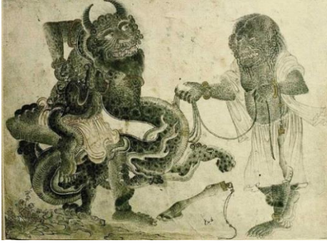
Resim-2: Salvador Dalí, Yanan Zürafa ( https://paratic.com , 2019)

çok güçlü basan ayaklar, vücudun dinamik hareketleri ve gözlerin keskin bakışları gerçek, hayal geçişlerini güçlendiren önemli unsurlardır. Yine dinamik anatomi ve farklı hayvanları anımsatan baş ayrıntıları Orta Asya Sanatının yansımaları olarak yorumlanmaktadır.