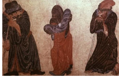
Resim-5: Gösteri (33,4x22,3) Hazine 2153,s.152 a.