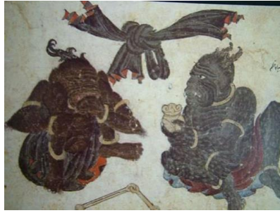
Resim -8: M. Siyah Kalem, “Moğol Düğümü ve iki Demon”, (23,7 x 17,4 cm), H. 2153, s.34b (İpşiroğlu, 2018:100)

Sürrealistlerin büyük bir bölümü manevi bir dünyanın göstergesi olarak, somut kanıtlar yerine olağanüstü varlıklardan yararlanmayı tercih etmişlerdir. Sürrealizmde alışılmışın dışında bir gerçeklik vardır. Bu gerçeklik, insanın bilinçaltı karmaşasını görsel malzemeler aracılığıyla çekip çıkarma gücüne sahiptir. Sürrealizm bilinç ve bilinç dışını birleştiren bir yol olarak da tanımlanabilir (Rona, 1997: 670). Mehmet Siyah Kalem'in figürlerinde trans hali şaman inanışının bir yansıması olarak değerlendirilebilir. Sanatçıyı Gerçeküstü yorumlara götüren aslında toplumsal değerler, tutumlar ve inançlar bütünüdür farklı bir şekilde etkileridir.