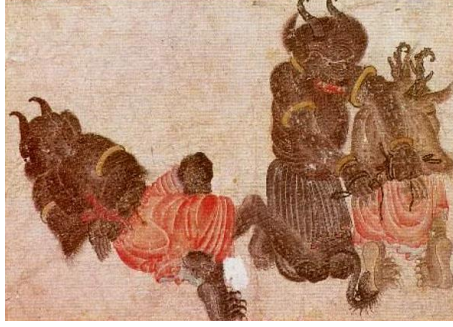
Resim -13: M. Siyah Kalem, “Bağlayan ve Bağlanan Demonlar”, (26,1x18,7). Hazine 2153, s.31 b. (İpşiroğlu, 2018:103).