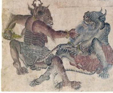
Resim-1: Dalaşan Demonlar (23,7 x 19,3). Hazine 2153, s. 37 b. (İpşiroğlu, 2018:101)

Orta Asya Şamanizm'inin ve İslami döneminin birbiriyle kaynaştığı Siyah Kalem üslubundaki resimlerin dini konulu sahnelerinde insan ve hayvan karışımı siyah, kırmızı, sarı derili ve çirkin, buruşuk yüzlü, boyunsuz devler tasvir edilmiştir.