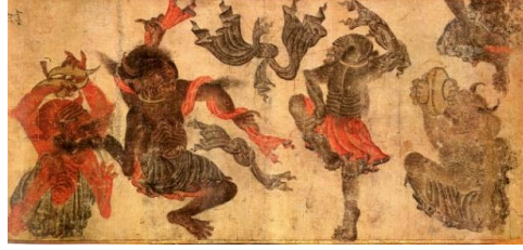
Resim-7: M. Siyah Kalem, “Demonların Dansı”, (İpşiroğlu ,2018:96-97)