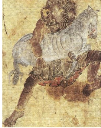
Resim -15: At kaçırın Demon, (15,3 x 19,6). Hazine 2153, s. 38 a (İpşiroğlu, 2018:104)

Topkapı Sarayı Müzesi, Hazine Kitaplığı'nda bulunan Gözlerden ates çıkan güçlü bir Demon, aygır atı kucaklayıp kaçırmaktadır. Demon vücudu kılıdır ve at sağlamdır; henüz parçalanmamıştır. Bu durum Demonun atı yemeye değil, Demon bilim kitaplarında vurgulandığı gibi bir “hüddam” olarak emredilen yere götürme vazifesini üstlendiğini gösterir. Beyaz renkteki bu atın kuyruğu bağlıdır. Bu sebeple Hun ve Uygur tasvirlerini aklımıza getirir. Daha sonraki dönemlerde ise, Osmanlı minyatürlerinde yer alan tasvirlerde, özellikle padişahın atında ve savaşçı atlarında, kuyruğun bağlı olması durumu sık sık yer almıştır. Bu durum atın bir soyluya ya da savaşçıya ait olduğunun göstergesidir (Göktaş,2008:147). Demon'un büyük kütledeki bir atı kucaklayarak kaçırma