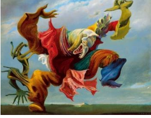
Resim-6: Max Ernst, Ev M eleği ( http://www.diesseits.de ,2019) (48,5 x 22,2) Hazine 2153, s. 64a