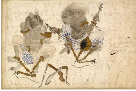
Resim-12: İçki içen , Çalgı Çalan Demonlar (22x14,6). Freer Gallery of Art, Washington.No: 37.25 (İpşiroğlu ,2018:108).

Hep hareket halinde, enerjik ve güçlü olan bu masalsı yaratıkların boyunlarında, kollarında ve bacaklarında altın halkalar bulunur. Maden çubuklar, zincir ve ziller ayrıca ruhları büyülemek için ince uzun bezler, ip, çıkrık ve ucuna bir ip bağlanmış hayvan ayakları gibi araçlar kullandıklarını resimlerden anlarız. Hareketleri ve gündelik iş sahneleriyle insan gibi davranışlar içindedirler ama şaşkın, öfkeli ve korkulu ifadeleri, postları, boynuzları ve kuyrukları onları farklılaştırır ( https://www.tarihli-sanat.com , 2019). Yumuşak-dekoratif üslupla yapılmış olan bu resim, resim -2 nin bir benzeri gibidir. Üslup dışında ufak tefek bazı değişiklikler göstermektedir. Görselde Demonlar'dan birinin elinde tuttuğu sürahi porselen ve üzerinde Siyah Kalem'lerin tarihlenmesinde büyük payı olan ejder motifi vardır. Demonlar ayaklarından demir çubuklarla bağlanmışlar ve altta, iki figürün ortasında resim 2 de gördüğümüz büyü öğeleri yer almaktadır (İpşiroğlu, 2018: 95). Siyah Kalem figürlerde gerçeküstücü yaklaşım içerisinde olup, müzik aleti ve diğer nesnelere realist bir yol takip etmiştir. Gerçek hayal ikileminde derin bağlantıyı ustaca sergilemiştir.