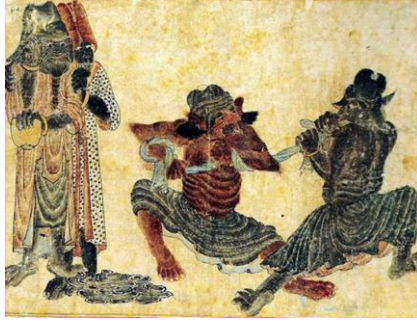
Resim-11 : Demonların Kuvvet Gösterisi(33x25. Hazine 2153, s,37a. (İpşiroğlu ,2018:89)

çıkarılmış, böylelikle konu izleyiciye direk verilmeye çalışılmıştır. Figürlerin duruşundan ve renginden çok güç sarf ettiklerini anlayabiliriz. Sanatçının bu resimde de daha çok sıcak renkleri kullandığı gözlemlenmektedir. Zemin çizgileri ile toprağın kuruluk etkisi verilmeye çalışılmıştır. Figürler de koyu renk kullanarak zeminden ayrılması sağlanmıştır. Mehmet Siyah Kalem plastik elemanlar dan çizgiyi, Van Gogh gibi yoğun kullanmış ve farklı yönlere çevirerek resmin bütünde etkiyi artırmıştır.