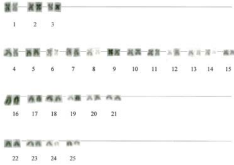
Şekil 3. Cyprinion macrostomus 'un karyotipi