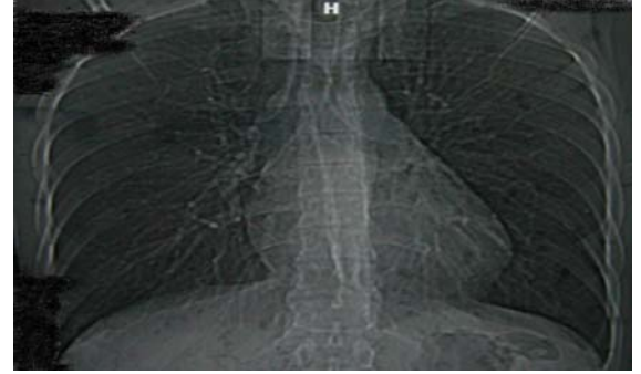
Resim 5. Tedavi sonrası düzelmiş akciğer grafisi.

Beşinci gün göğüs tüpü çıkartıldı ve hasta taburcu edildi. Bir ay sonraki bilgisayarlı toraks tomografisi tamamen normaldi (Resim 6).