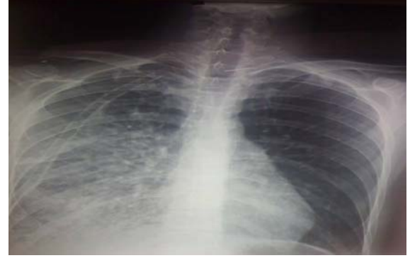
Resim 4. Sağ akciğer ekspansiyonu olmuş. Orta ve alt zonda infiltrasyon ve konsolide alanlar.

durumunun iyi olması ve radyolojik olarak düzelmesi üzerine hasta ekstübe edildi ve takibinde servise alındı (Resim 5).