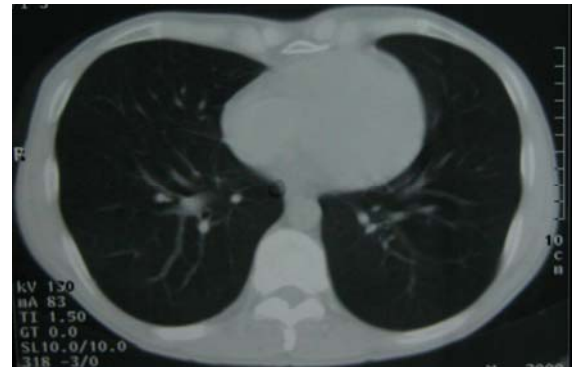
Resim 6. Bir ay sonraki tamamen düzelmiş toraks BT.

Beşinci gün göğüs tüpü çıkartıldı ve hasta taburcu edildi. Bir ay sonraki bilgisayarlı toraks tomografisi tamamen normaldi (Resim 6).