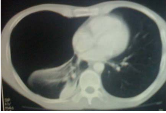
Resim 2. Toraks BT'de sağda total pnömotoraks ve kollabe olmuş akciğer izlenmektedir.