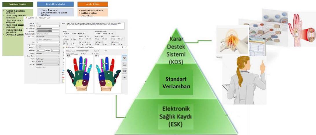
Şekil 1. Çalışmanın yazılım mimarisi (The software architecture of this study)

Bu çalışmada Yazılım geliştirmeden önce hâlihazırda kullanılan ESK sisteminin yazılım ve donanım fizibilitesinin yanı sıra yasal durum ve mevzuatlar incelenmiştir. Daha sonra gerçek sorun ve olası çözümler için doktor ve teknisyenler ile görüşmeler yapılmış ve bu hâlihazırda klinik uygulamalarda son kullanıcılar ile birlikte beyin fırtınası gerçekleştirilmiştir. Geliştirilen yazılım için ihtiyaç analizi yapılarak sistemin mevcut sistemler ile çalışabilirlik ihtiyaç ve kısıtları belirlenmiş, alternatif çözümler, maliyet ve performans karşılaştırmaları yapılmıştır. KTS tabanlı ESK sisteminin geliştirilmesinde, Microsoft Visual Studio 2013 ortamında C# programlama dili kullanılmıştır. Veri tabanı işlemleri ise Microsoft Access yazılımı ile geliştirilmiştir. Şekil 1'de yazılımın mimarisi gösterilmiştir.