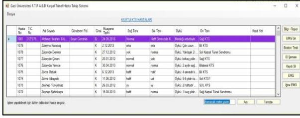
Şekil 4. Kayıtlı hastalar için bilgi ekranı resmi (The picture of the information screen for registered patients)

Hasta bilgileri, bu ekran aracılığıyla güncellenir. EMG butonuna basılarak açılan EMG ekranından hastaya ait “.txt” uzantılı dosyalar programa yüklenir. Bu ekran ile grafikler görüntülenebilir, grafikleri oluşturan .txt dosyaları hasta bazında kaydedilebilir ve daha önce kaydedilen dosyaları açılarak eski grafikleri görüntülenebilir.