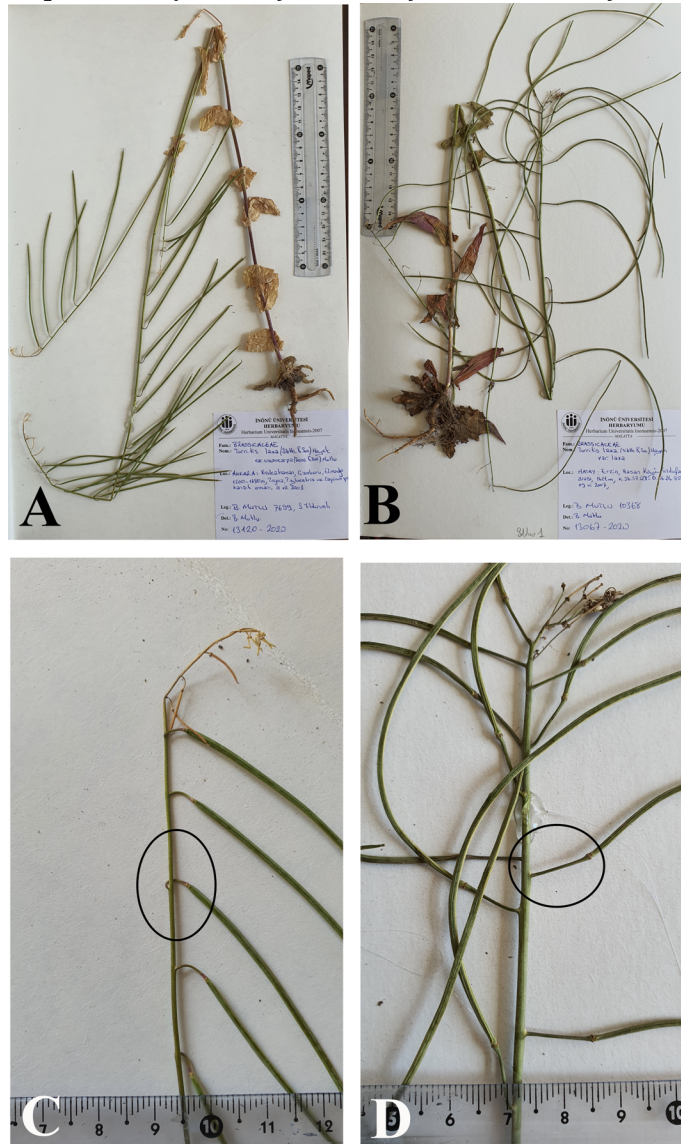
Şekil 1. Turritis laxa türüne ait varyetelerin INU herbaryum kartonları ve bu kartondaki örneklerin meyve sapları. A, C- T. laxa var. cremocarpa (INU 13120-2020); B, D- T. laxa var. laxa (INU 13067-2020). Siyah halkalar olgun meyve saplarını işaret etmektedir.

Üzerinde çalışma yapılan herbaryum kartonlarından INU herbaryumunda yer alan 2 tanesi ve bu kartonlar üzerindeki örneklere ait meyve saplarının büyütülmüş resimleri Şekil 1’de verilmiştir.