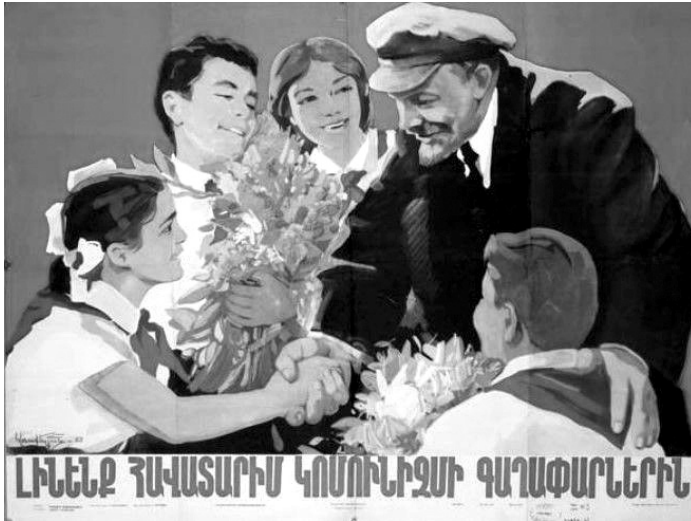
Resim 2: "Çocuklar" Konulu Propaganda Posterleri

"Çocuklar" konulu propaganda posterleri, 1962 yılında Gevork Arakelian tarafından hazırlanmıştır. Sözdizimsel boyutta analiz edildiğinde posterde Lenin'in çocuklar ile iç içe olduğu görülmektedir. Çocukların üzerinde okul üniformalarının olduğu ve Lenin'e çiçek sundukları yansıtılmaktadır. Posterde hem Lenin'in hem de çocukların gülümsediği, Lenin'in bir eliyle çocuklardan birinin elini sıkığı, diğer eliyle de çocuklardan birinin omzuna dokunduğu aktarılmaktadır. Posterin fonunun çalışma kapsamında incelenen ilk posterde olduğu kırmızı olduğu görülmektedir. Posterin altında Komünizm'in fikirlerine sadık kalalım (Լիեննի քաղաքատարիւն կոմունիզմի գաղափարներին) yazısına yer verilmektedir.