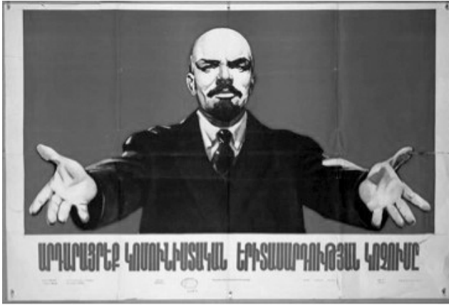
Resim 1: “Komünist Gençlik” Konulu Propaganda Posterini

“Komünist Gençlik” konulu propaganda posterini, 1958 yılında Gevork Arakelian tarafından hazırlanmıştır. Sözdizimsel boyutta incelendiğinde posterde kırmızı bir fonda Lenin’in iki elini açarak posterini izleyenlere doğru baktığı görülmektedir. Posterin altında Komünist gençliğe uygun yaşayın (Արդարացրէք կոմունիստական երիտասարդության կոչումը) yazısına yer verilmektedir.