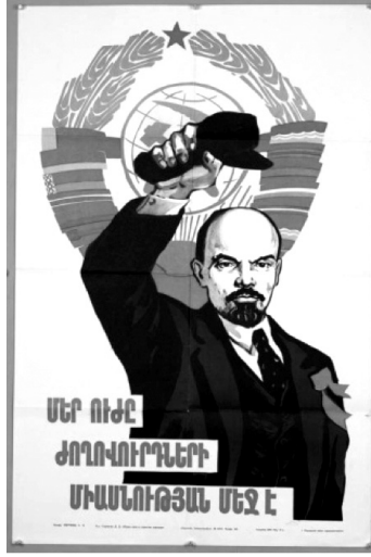
Resim 3: “Birlik” Konulu Propaganda Poster

Anlambilimsel boyutta analiz edildiğinde posterdeki görsel ve yazılı kodlar bir arada okunduğunda, Sovyetler Birliği’ni oluşturan ülkelerin birliğinin Lenin üzerinden somutlandığı ortaya çıkmaktadır. Posterde Lenin üzerinden birlik mesajının verildiği ve Komünizm’in güçlü ve etkili olabilmesinde birliğin önemli olduğu vurgulanmaktadır. Edibilimsel boyutta incelendiğinde posterde Komünizm ideolojisinin güçlü olabilmesi için Komünizm ile yönetilen ülkelerin Lenin’in öğretileri doğrultusunda birlik olması gerektiği çıkarımı ortaya konulmaktadır.