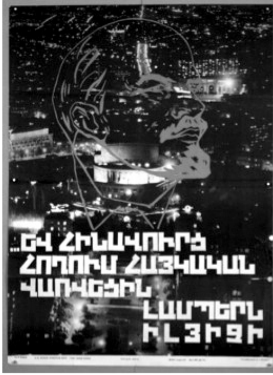
Resim 5: “Aydınlık” Konulu Propaganda Posteri (Kaynak: IDEP, 2020e)

Anlambilimsel boyutta analiz edildiğinde posterde Lenin liderliğinde ESSC'nin gelişmiş bir ülke haline geldiği mesajı verilmektedir. Bu süreçte Erivan'ın ışıklar içerisinde gösterilmesi ve posterin merkezine Lenin'in resminin konumlandırılması ile ESSC'de yaşanan gelişmelerin temelinde Lenin olduğu vurgusu yapılmaktadır. Posterde eski Ermenistan olarak Komünizm ideolojisinin Ermenistan'a hakim olmadığı dönemlere vurgu yapılmakta ve Lenin liderliğinde Komünizm ideolojisiyle birlikte Ermenistan'da yaşanan teknolojik gelişmeler ön plana çıkarılmaya çalışılmaktadır. Edimbilimsel boyutta incelendiğinde posterde Ermeni halkının ESSC'de yaşanan gelişmelerden dolayı Lenin'e minnet duyması gerektiğine yönelik çıkarım ortaya konulmaktadır.