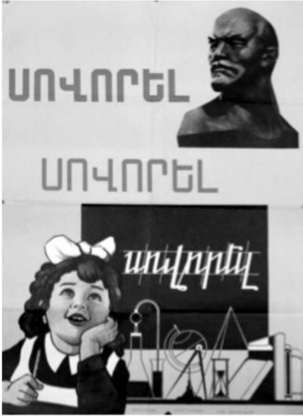
Resim 4: “Eğitim” Konulu Propaganda Posterleri

“Eğitim” konulu propaganda posterleri, 1970 yılında Sergei Aveti Arutchyan tarafından hazırlanmıştır. Sözdizimsel boyutta analiz edildiğinde posterin sol üstünde Lenin’e ait bir büst görseline ve sağ altında ise bir kız öğrencinin görseline yer verildiği görülmektedir. Öğrencinin bir elini başına koyarak Lenin’i düşündüğü, diğer eliyle de kalem tuttuğu yansıtılmaktadır. Öğrencinin arkasında yazı tahtası ve okul materyallerinin olduğu görülmektedir. Posterde büyük puntolarda yukarıdan aşağıya doğru Öğren, Öğren, Öğren... (Սովորել, սովորել, սովորել...) yazısına yer verilmektedir.