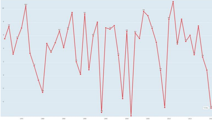
Şekil 2: Tek Dalga Senaryosuna Göre Türkiye'nin Reel Milli Gelir Yıllık Büyüme Oranı Tahmini (1971-2020)

OECD'nin Türkiye için ikinci dalga senaryosunda büyüme tahminini agresif bir şekilde aşağıya çekmesinin muhtemel nedenlerinden biri en büyük ihracat pazarımız olan EURO bölgesinde %10'a yakın bir küçülmenin bekleniyor olması ve ihracata dayalı bir büyüme modeli benimseyen Türkiye'nin finansal dış kaynağa olduğu kadar hammadde ve ara malı anlamında da dış kaynaklara bağımlı olduğu gerçeğidir. COVID-19'dan bağımsız olarak bu tablonun değişmesi için mevcut ticari portföyün yüksek katma değerli ve yüksek teknoloji kullanımına dayalı ürün ve hizmetlere dönüşümünün sağlanması gerekir. Bunun yatırım yapılmış bir ülke algısı ve itibarlı, yenilikçi, sürdürülebilir ve güvenilir markalarla desteklenmemesi durumunda uzun soluklu bir iyileşmeden söz etmek zor olacaktır.