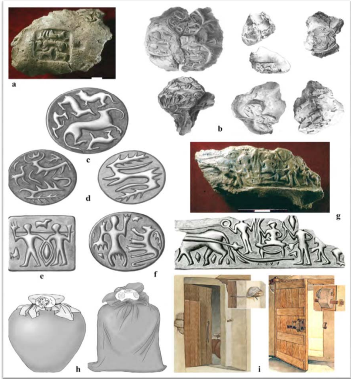
Şekil 4: Höyükte Bulunan Mühürler ve Çizimleri (Frangipane, 2018: 84).

Çok sayıda mühür, kabartma (Şekil 6) ve duvar bezemelerinin olması saray işlerinin belirli kurallarca yapıldığını ve idari işlerin varlığını göstermektedir. Bulunan iki binden fazla öge (mühür, cretula vb.) depolama ve muhasebe sisteminin güçlü olduğuna işarettir (Frangipane: 2012: 34). Depolamanın ve dağıtımın farklı alanlarda yapılması, yerleşim yerinde bir tür uzmanlık ve işbölümü anlayışının izlerine işaret edebilir. Ayrıca dağıtımın belirli mühürler ile yapılması dağıtan memurların olduğunu göstermektedir. Muhtemelen memurlar, üst otoriteden aldığı yetki ile hareket etmekte ve yaşamın sürdürülebilmesi için işbölümü yapmaktadır. Bu kararların belirli usul ve kaidelere göre yapıldığı düşünülmektedir. Ayrıca iki yüzden fazla mühürde tarım ve hayvancılığı simgeleyen figürler (Şekil 4, a-g) bulunmaktadır. Bu bulgunun ise toplumun geçim kaynakları ile ilgili bilgiler taşıdığı düşünülebilir. Bu figürlerin kendi içinde bir sistematik içerisinde olduğu söylenebilir.