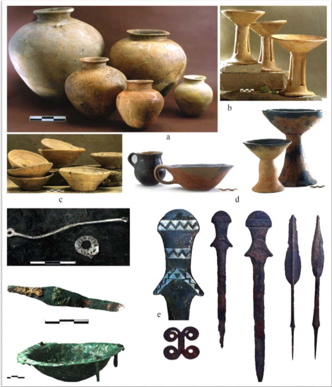
Şekil 5: Arslantepe’de Seramik ve Metal Objeler (Frangipane, 2018: 86).

Arslantepe’de çok özenli bir şekilde metal ürünlerin imal edildiği ve farklı türde metaller kullanıldığı görülmüştür. Bakır, kurşun, altın, gümüş ve metal alaşımlı öğeler dönemin madenciliği hakkında önemli fikirler vermektedir. En önemli metal öğeler arasında mızrak uçları ve kılıçlar yer almaktadır (Şekil 5). Her biri farklı metal ve büyüklükte olan öğeler muhtemelen şef veya rütbeli kişilerin saygınlığı ile doğru orantılı olarak imal edilmiştir (Frangipane, 2018: 97). Bu durum askeri hiyerarşinin varlığına işaret etmektedir. Bir başka açıdan yüksek statülü bir kişinin mezarı (Kral mezarı) taş sanduka içinde bulunmuştur. Burada ise metal nesne, silah ve mücevher gibi farklı semboller bulunması siyasi ve askeri hiyerarşik yapıyı çağrıştırmakta ve lidere, komutana verilen önemi ifade etmektedir. Liderin gücü ve otoritesinin vurgulanması ve hiyerarşik bir yapının oluşması geleneksel bürokrasinin izlerine işaret etmektedir.