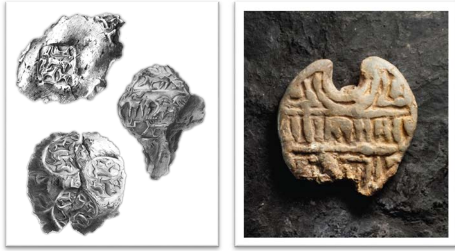
Şekil 6: Mühür ve Kabartmalar (Atlas, 2015).

Arslantepe’de kral veya liderin ihtişamlı bir iktidar alanı olduğu söylenebilir. Söz konusu iktidarın tepenin en üst noktasında saray yapılanmasında olduğu düşünülmektedir. Ayrıca devredilmiş yetkilere sahip bir memur sınıfı olarak bürokrasinin ortaya çıkışı, Astantepe’de erken devlet ve bürokrasi adına önemli bir bulgudur (Frangipane, 2018: 10). İktidar veya güç bağlamında duvar resimlerinin binaya erişim alanları boyunca en belirgin yerlere yerleştirilmesi, korundukları resimlerin saf ve basit süslemeler olmadığını, bu resim veya çizimlerin önemli figüratif motifleri temsil ettiği düşünülmektedir. Sembolik içeriği nedeniyle ziyaretçiye ideolojik mesajlar da vermektedir. Saray kompleksinin iki bölgesinde (mağazalara ve iç avluya erişim odası ve koridorun en kuzey bölümü) olağanüstü iyi korunmuş figürler, son aşamada yok edilmiştir (Frangipane, 1997a: 64).