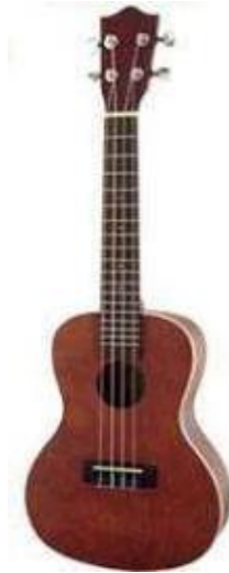
Şekil 3. Konser Tipi Ukulele (Ukuguides, 2020)

Konser Tipi Ukulele: Soprano Ukulele'ye nazaran daha uzun (58 cm) olan konser tipi Ukulele'nin gövdesi daha büyük ve klavyesi daha uzundur. Perdeler arasında daha fazla boşluk olduğundan dolayı, soprano Ukulele'ye nazaran tutması biraz daha kolaydır. Soprano Ukulele'den daha yüksek bir sese sahiptir. Telleri yukarıdan aşağıya doğru G, C, E, A (sol, do, mi, la) olarak sıralanır (Giebelhausen, 2016).