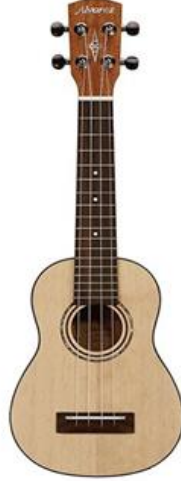
Şekil 2. Soprano Ukulele

Soprano Ukulele: Geleneksel Hawaii Ukulele'si olmakla beraber en fazla kullanılan formudur. Dört çeşit arasında en küçük boyutlara sahip olan (53 cm) soprano Ukulele, parlak ama yumuşak bir tona sahip olup, yeni başlayanlar için en ideal olanıdır. Telleri yukarıdan aşağıya doğru G, C, E, A (sol, do, mi, la) olarak sıralanır (Andreas, 2015).