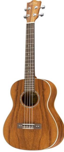
Şekil 5. Bariton Ukulele (McQueen, 2020)

Ukulelelerin büyüklüğü her ne kadar birbirlerine yakın olsalar da çalgının gövdesindeki hacmin genişliği, farklı ses dolgunluğunu beraberinde getirecektir. Bununla beraber klavye boyu da daha fazla ses aralığına ulaşılması bakımından önemlidir.