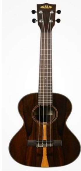
Şekil 4. Tenor Ukulele (Kalabrand, 2020)

parmakları daha büyük olanlar için tenor Ukulele ideal boyutlardadır. Boyutlarının büyük olmasından dolayı, daha derin, daha dolgun ve rezonanslı, neredeyse bas tonlu bir ses verir. Ses ve tını olarak sesi daha geniş hacimlidir. Seyirci karşısında çalanlar genellikle tenor Ukulele'yi tercih ederler. Bunun sebebi ise daha zengin bir ses aralığı sunmasıdır. Telleri yukarıdan aşağıya doğru G, C, E, A (sol, do, mi, la) olarak sıralanır (Kalabrand, 2020).