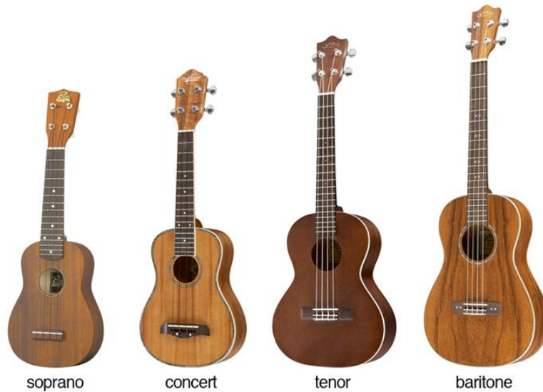
Şekil 1. Ukulele çeşitleri (McQueen, 2020)

Soprano, Konser, Tenor ve Bariton Ukulele'lere zaman içerisinde Banjo ve Resonator Ukulele'ler eklense de 21. yüzyılda genel olarak Soprano, Konser, Tenor ve Bariton Ukulele'ler popüler olmuştur (Andreas, 2015; Laidlaw, 2017; Leonard, 2014; Young, 2016). Bu formlar şekil 1' de görülmektedir.