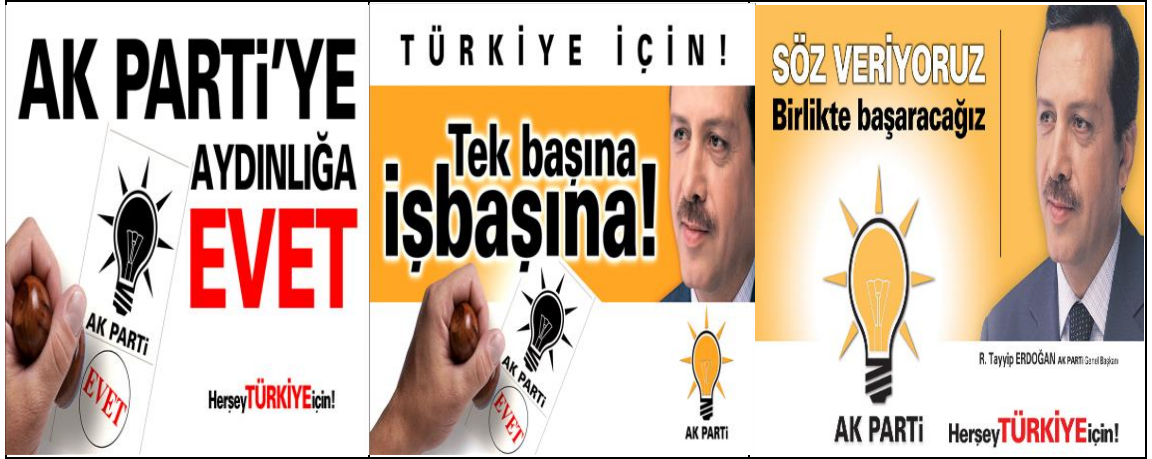
Resim 1: Ak Parti 2002 Genel Seçim Afişi