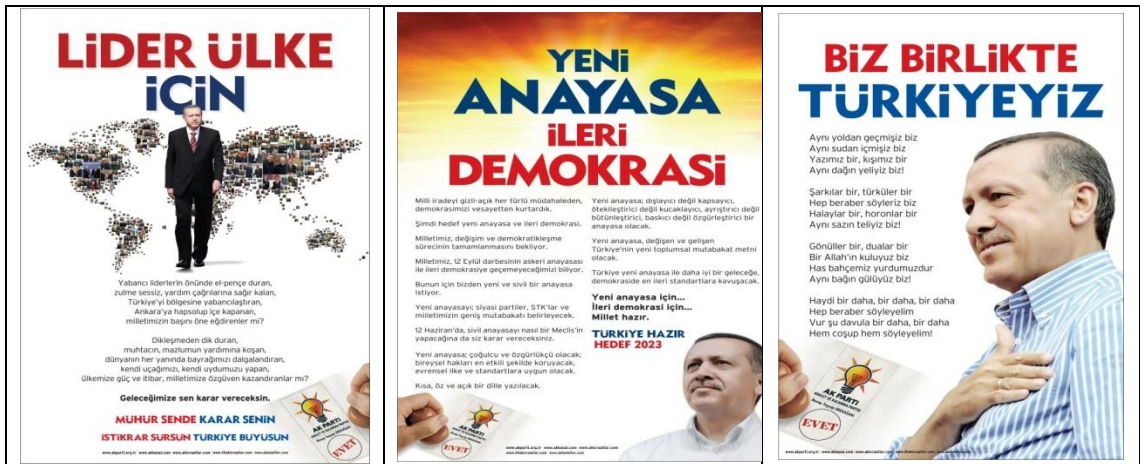
Resim 5: Ak Parti 2011 Genel Seçim Afışı 2

İktidar partisi olmanın avantajını kullanan Ak Parti, seçim kampanyaları başlamadan önce illerde düzenlenen açılış programlarında seçime yönelik vaatlerini ortaya koymuştur. Seçime en hazırlıklı parti olarak, başta İstanbul olmak üzere birçok büyükşehir için hazırladığı “Çılgın Projeler” ile ülke gündeminde tartışılmıştır. Yapmış oldukları büyük projeleri “Hayaldi gerçek oldu” söylemiyle anlatırken, 2023 hedeflerini ise “Türkiye hazır hedef 2023” sloganı ile simgeleştirmiştir. Bu seçim döneminin sonuna doğru “Biz Birlikte Türkiye’yiz” türküsü ile de Ak Parti seçmenlerin beğenisini toplamıştır (Akay, 2012: 149).