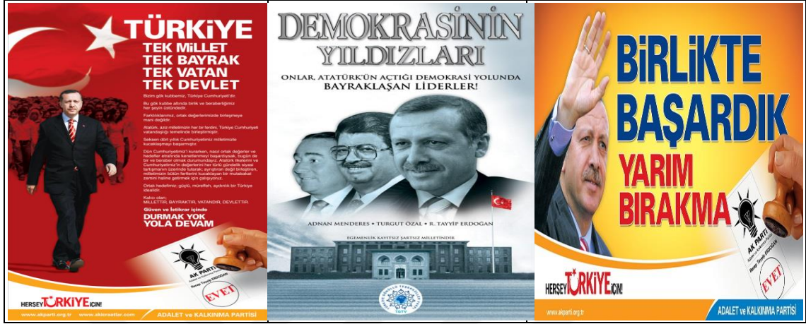
Resim 2: Ak Parti 2007 Genel Seçim Afişi I

olsa da, Ak Parti aldığı karar gereğince hiçbir tartışma programına katılmamıştır (Akay, 2012: 135).