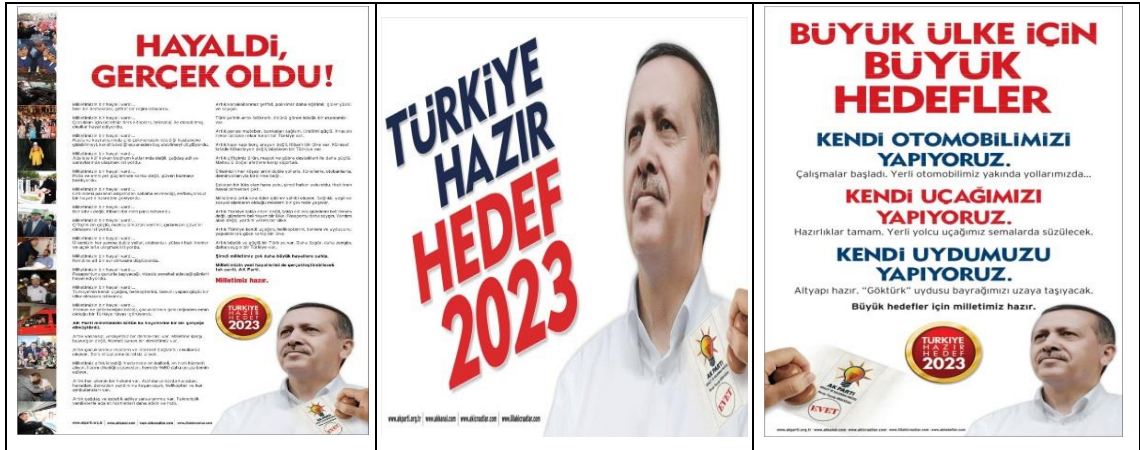
Resim 4: Ak Parti 2011 Genel Seçim Afışı 1