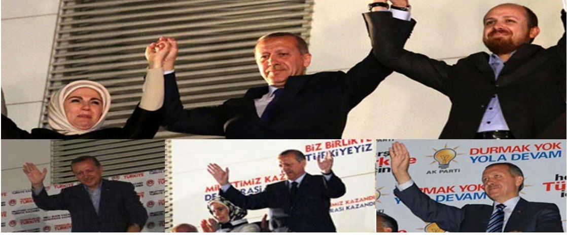
Resim 7: Balkon Konuşmaları