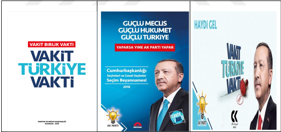
Resim 6: Ak Parti 2018 Genel Seçim Afışı

24 Haziran 2018 yılında yapılan seçimlerle birlikte Türkiye’de Cumhurbaşkanlığı Hükümet Sistemi olarak adlandırılan yeni sistem fiili anlamda uygulanmaya başlanmıştır. 16 Nisan 2017 tarihinde yapılan halkoylamasında, parlamenter sistemden başkanlık sistemine geçişi sağlayan anayasa değişikliği için sandığa gidilmiş ve halktan onay alınmıştır. Anayasa değişikliğinin ardından yeni hükümet sisteminin tam anlamıyla uygulanabilmesi için hem kurumsal düzenlemelere hem de yapılacak seçimlerle yasama ve yürütme organının belirlenmesine ihtiyaç duyulmuştur. Ayrıca, bu seçimlerde hem Cumhurbaşkanı hem de milletvekili seçimi yapılarak, Cumhurbaşkanı seçilen kişi aynı zamanda yürütmenin başına geçerek hükümeti kurmuş olacaktır.