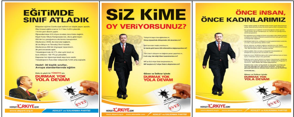
Resim 3: Ak Parti 2007 Genel Seçim Afişi 2