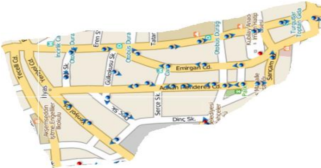
Şekil 4. İlaçlama aracının 06.09.2017 tarihinde İlyas mahallesinde ki dolaştığı rota

Şekil 4'de görüldüğü gibi araç her bir cadde/sokağa girme zorunluluğunu uygulamamış ve tamamen rastsal olarak bir rota çizmiştir. Buna göre araç 229016,93 m 2 ' lik alana sahip İlyas mahallesini toplam 5141,24 m lik ilaçlaması gereken cadde/sokaktan yine Arvento programından alınan 06.09.2017 tarihli rapora göre 1641,24 m' lik alanı ilaçlamamış, yaklaşık 3.500 m lik bir kısmı ilaçlayarak 20 dk lık sürede mahalleyi terk etmiştir. Araç her cadde/sokağa girme zorunluluğuna uymamıştır.