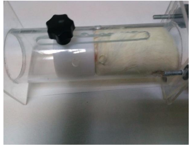
Şekil 1. Deneklere kısıtlama stresi uygulanması

Deney Grubu (n=10): Deneklerin sağ ve sol 1. molar dişlerinin etrafına genel anestezi altında (10 mg/kg Xylazine®, 40 mg/kg ketamin), deneysel periodontitis oluşturmak amacıyla ipek sütün subgingival bağlanarak dişlerin mezialinde düğümlendi (6). Tüm denekler 28 günlük deneysel periodontitis oluşturma sürecinde günlük 2,5 saat özel aparatlar vasıtasıyla kısıtlama stresine maruz bırakıldı (Şekil 1). Tüm denekler 28 günlük deneysel periodontitis sürecinden sonra sakrifiye edildi (12). Deneklerin derin anestezi altında sağ ve sol alt çeneleri kas dokularında uzaklaştırılarak alındı ve kalplerinden kan alınarak serum örnekleri elde edildi, serum örnekleri analiz gününe kadar -80 °C'de bekletildi.